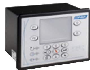
Contrôleur BFC (version panel) BFC Controller (panel version) BFC (Schalttafeleinbau)

Das Durchlaufmessgerät wird an eine BFC Auswerteelektronik - mit Gehäuse für Wandmontage oder Schalttafeleinbau - angeschlossen. Schnittstelle: